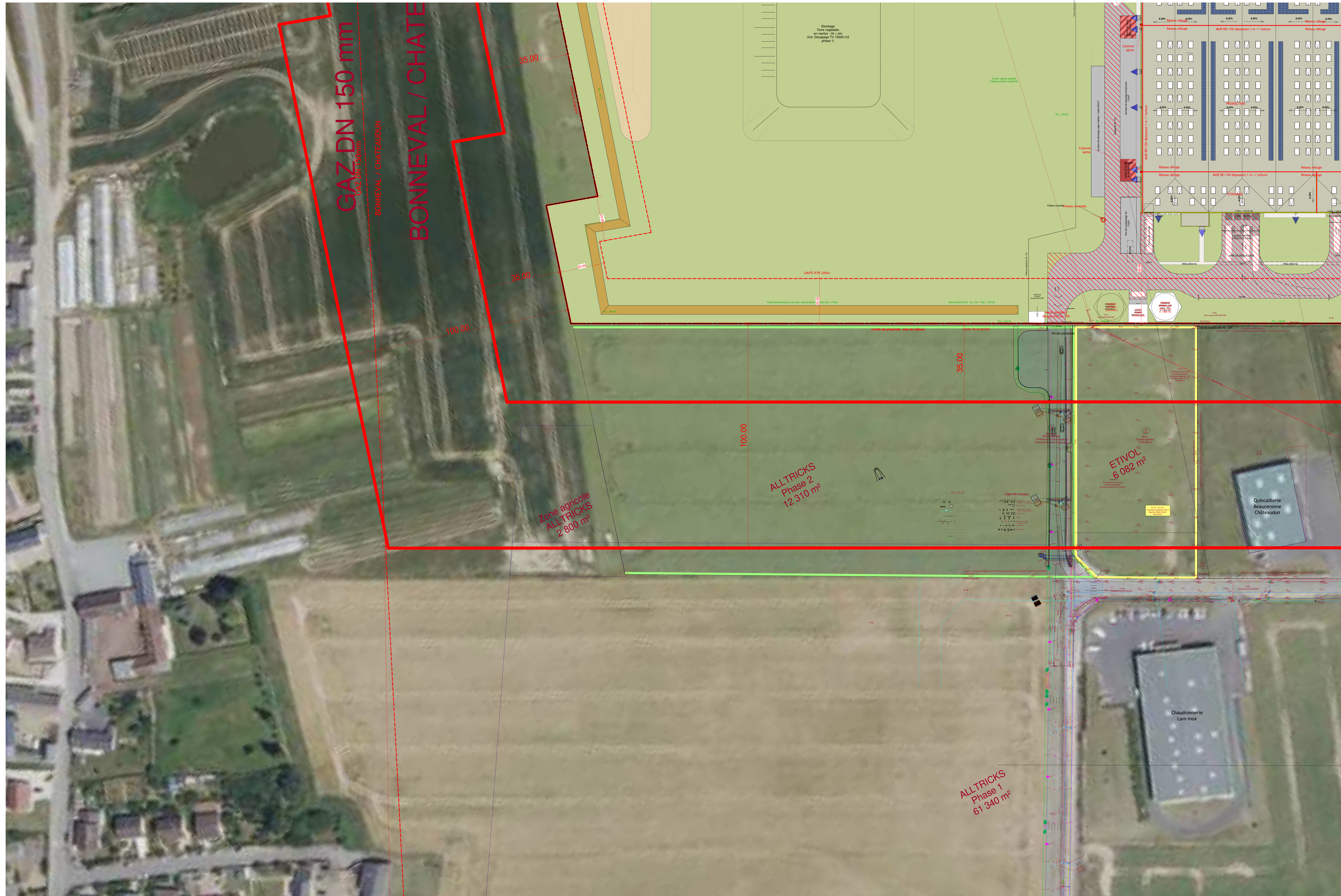
▲ ZONE C 1 : 500